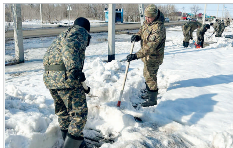
НАЦГВАРДИЯ ПРОТИВ ПАВОДКОВ. КОМАНДИРОВКА В ЗОНЫ РИСКА