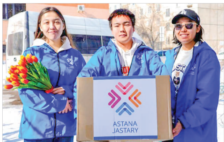
БЛАГОДАРИМ ЗА ТРУД! ВОЛОНТЕРЫ УГОСТИЛИ КОММУНАЛЬЩИКОВ