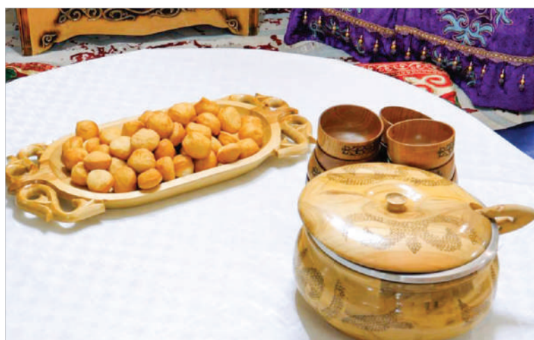
МАСТЕР-КЛАСС ПО ПРИГОТОВЛЕНИЮ НАЦИОНАЛЬНЫХ БЛЮД