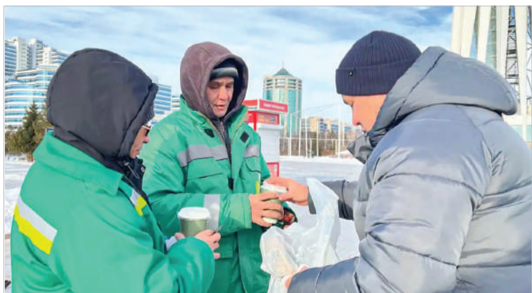
ЧАЙ НА МОРОЗЕ ОЧЕНЬ КСТАТИ. ВОЛОНТЕРСКАЯ ПОДДЕРЖКА