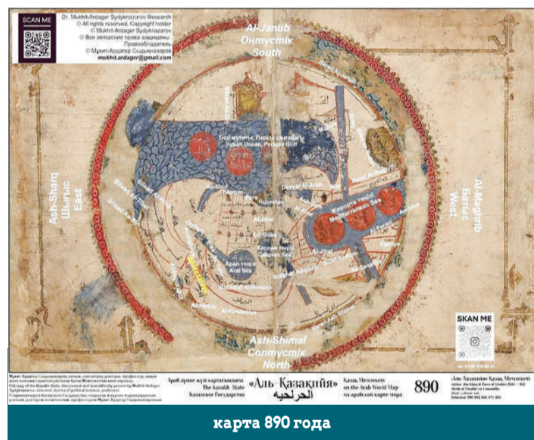
карта 890 года