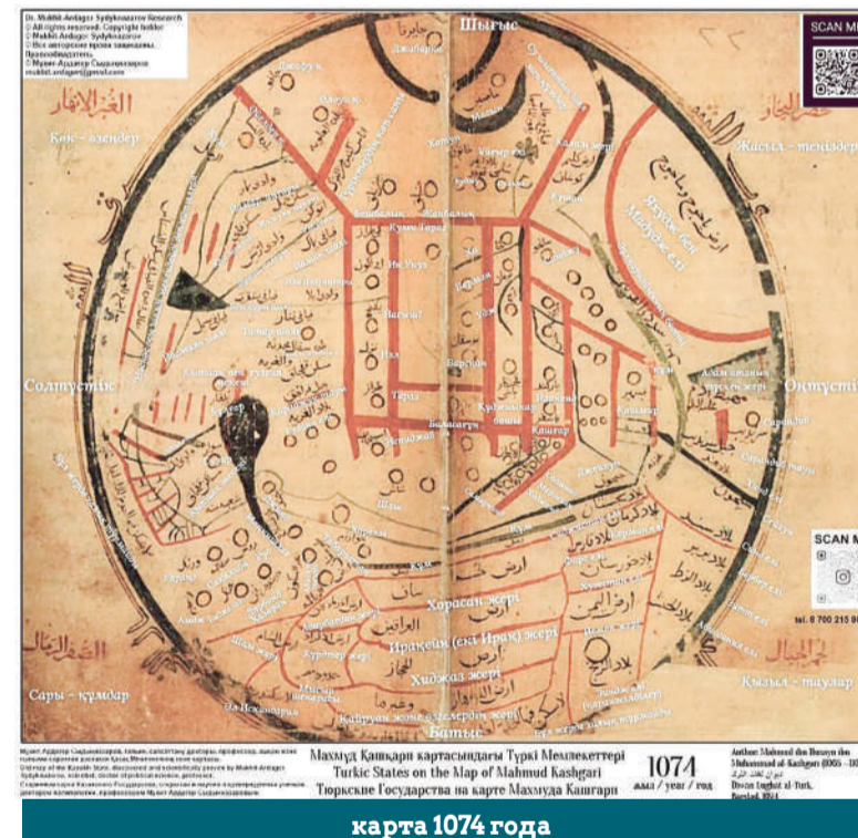
карта 1074 года

Итак, все по порядку. - Как уже упоминалось, географические объекты имеют цветовую кодировку. Таким образом, моря - зеленые, реки - синие, горы - красные, а города - желтые, - продолжает собеседник. - Вся географическая номенклатура карты Махмудом Кашгари написана арабской графикой, как и вся его книга. Карта мира имеет ориентацию восток (вверху) - за-