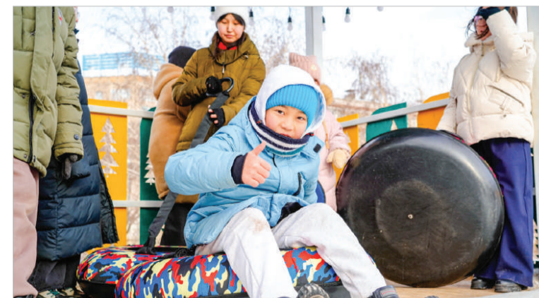
НОВАЯ ЛОКАЦИЯ ДЛЯ АКТИВНОГО ОТДЫХА ДЕТЕЙ И ВЗРОСЛЫХ