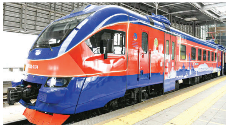
ПОЕЗД АСТАНА - БОРОВОЕ. НЕ ТОЛЬКО КОМФОРТНО, НО И ПОЗНАВАТЕЛЬНО