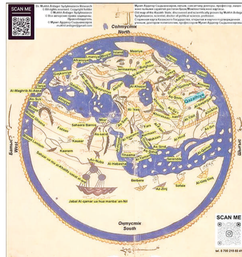
карта 1154 года