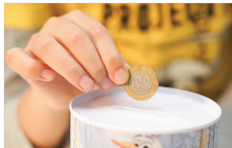
КАК РАБОТАЕТ ПРОГРАММА «НАЦИОНАЛЬНЫЙ ФОНД - ДЕТЯМ»