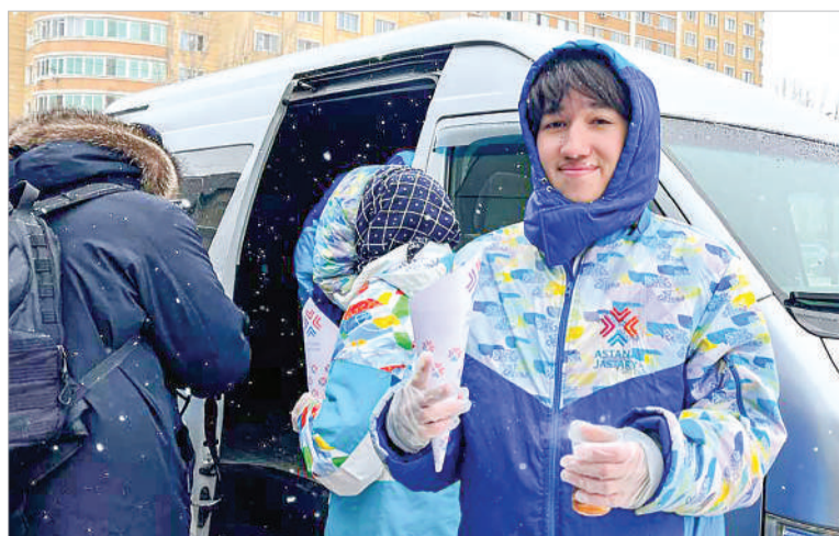
ГОРЯЧИЙ ЧАЙ СОГРЕЕТ ГОРОЖАН В ЛЮБУЮ ПОГОДУ