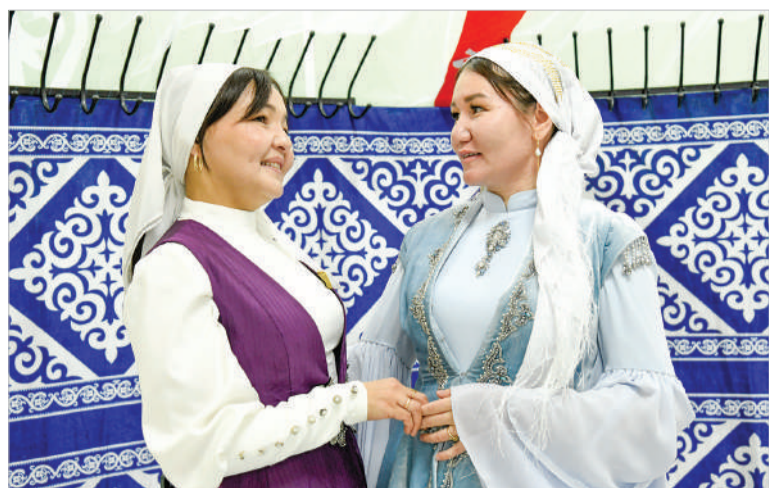
РЕСПУБЛИКАНСКИЙ КОНКУРС: ХРАНИМ СЕМЕЙНЫЕ ТРАДИЦИИ