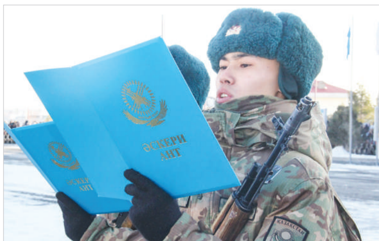
700 НОВОБРАНЦЕВ В СТОЛИЧНОЙ БРИГАДЕ. МОЛОДЫЕ СОЛДАТЫ ПРИНЯЛИ ПРИСЯГУ СТР. 3 | ПОВЕСТКА ДНЯ