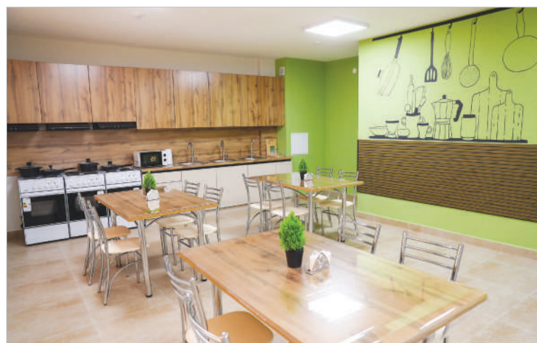
ОБЩЕЖИТИЕ НОВОГО ФОРМАТА ДЛЯ КОМФОРТА СТУДЕНТОВ СТР. 4 | МОЛОДЕЖНАЯ ПОЛИТИКА